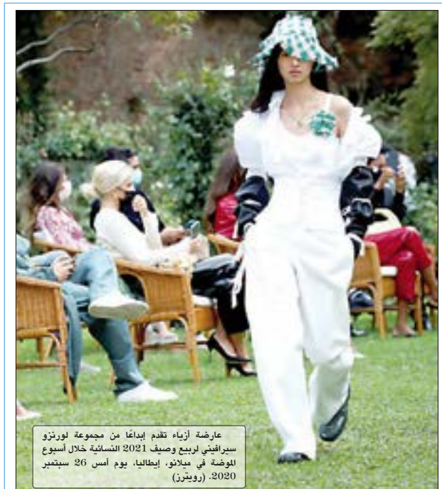
عارضة أزياء تقدم إبداعاً من مجموعة لورنزو سيرافيني لربيع وصيف 2021 النسائية خلال أسبوع الموضة في ميلانو، إيطاليا، يوم أمس 26 سبتمبر 2020.

1825 - أول استخدام لسكة الحديد كوسيلة نقل عام. 1914 - الإمبراطورية الروسية تحتل المجر. 1922 - ملك اليونان قسطنطين الأول يتنحى عن العرش. 1987 - الرئيسان المصري محمد حسني مبارك والفرنسي فرانسوا ميتران يفتتحان أول خطوط مترو أنفاق القاهرة. 1990 - الرئيس الجزائري الأسبق أحمد بن بلة يعود للجزائر بعد 9 سنوات في المنفى. 1997 - انتخاب المصري محمد البرادعي رئيساً للوكالة الدولية للطاقة الذرية. 1998 - افتتاح شركة جوجل. 2002 - تيمور الشرقية تنضم إلى الأمم المتحدة. 2005 - الحلقة 163 والأخيرة من توم جيري تعرض بعنوان «حارس الكاراتيه». 2007 - ناسا تطلق المسبار دونوف في مهمة إلى كويكب 4 فيستا الذي وصلته المركبة عام 2011 والكوكب القزم سيريس الذي وصلته في عام 2015. 2015 - فوز القوى الكاتالونية ذات النزعة الانفصالية بالغالبية المطلقة داخل البرلمان بعدما حصلت على أكثر من نصف الأصوات في الانتخابات البرلمانية في إقليم كاتالونيا في إسبانيا.