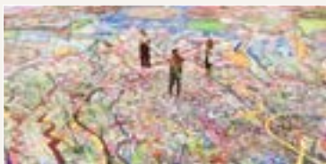
جافري (٤٤ عاماً) في أن يضاهف المبالغ المجموعة عندما تراج أجزاء لوحته رحلة من أجل البشرية، في المزاد العلني في فبراير ٢٠٢١.