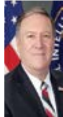
○ وزير الخارجية الأمريكي