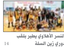
النسر الأهلاوي يطير بلقب دوري زين السلة

74% نسبة الإقبال في قرية الميركادو وتسارع وتيرة الطلب على وحداتها