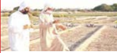
مزارعان في إحدى مزارع بوري (03)