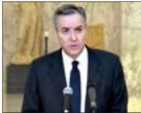
أديب يعلن اعتذاره عن تشكيل الحكومة اللبنانية

«أديب» يعتذر عن تشكيل الحكومة وفرنسا تتهم الأحزاب اللبنانية بـ«الخيانة»